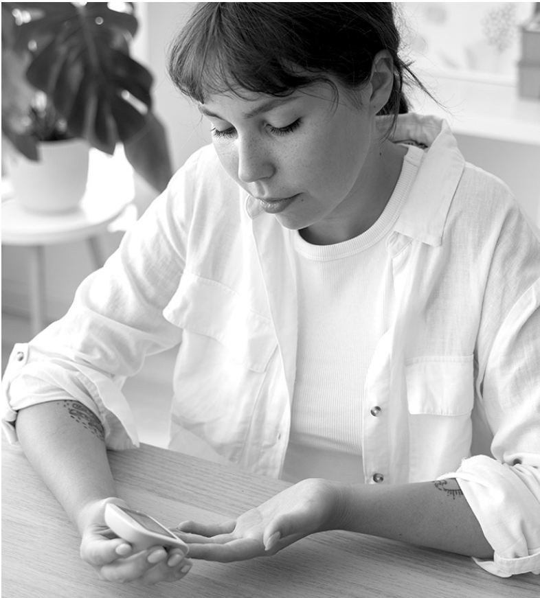
Чрезмерное потребление сахара может привести к ряду заболеваний

И еще, отказавшись от сахара, вы получите прекрасный побочный эффект — неизбежно снизится общий объем потребляемых калорий в сутки. Простая арифметика: отказавшись от сахара, вы будете потреблять на 200 калорий в день меньше, а это поможет скинуть порядка 4,5 кг за 5–6 месяцев. Игра стоит свеч, верно?