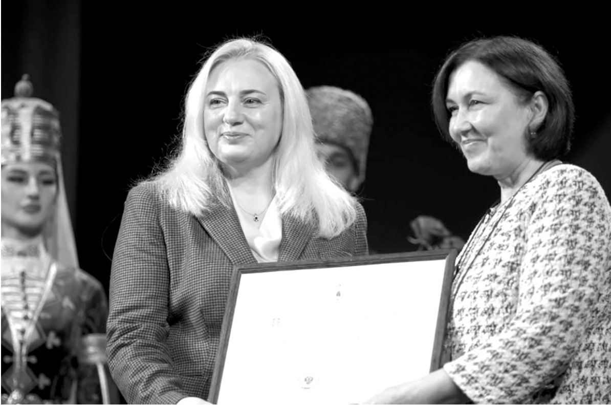
В этот день коллектив библиотеки получил множество поздравлений

Со словами поздравлений от имени главы региона Мурата Кумпилова к собравшимся обратился заместитель председателя кабинета