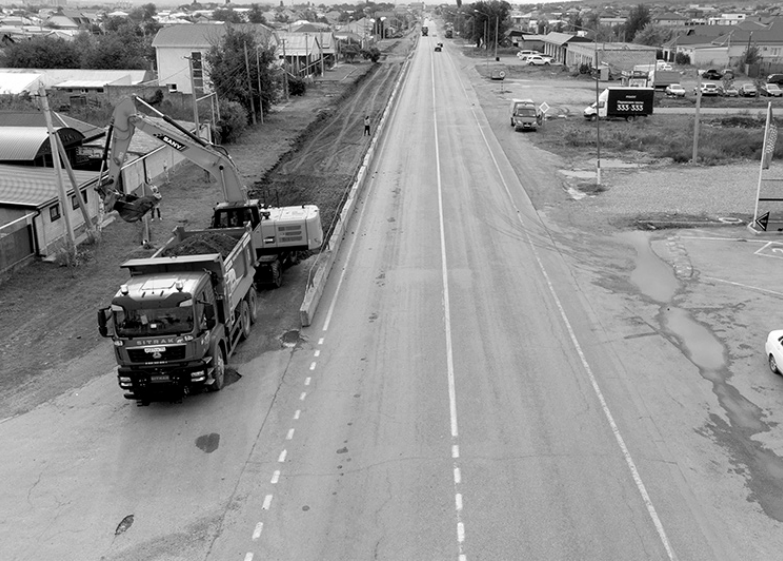
Идут ремонтные работы