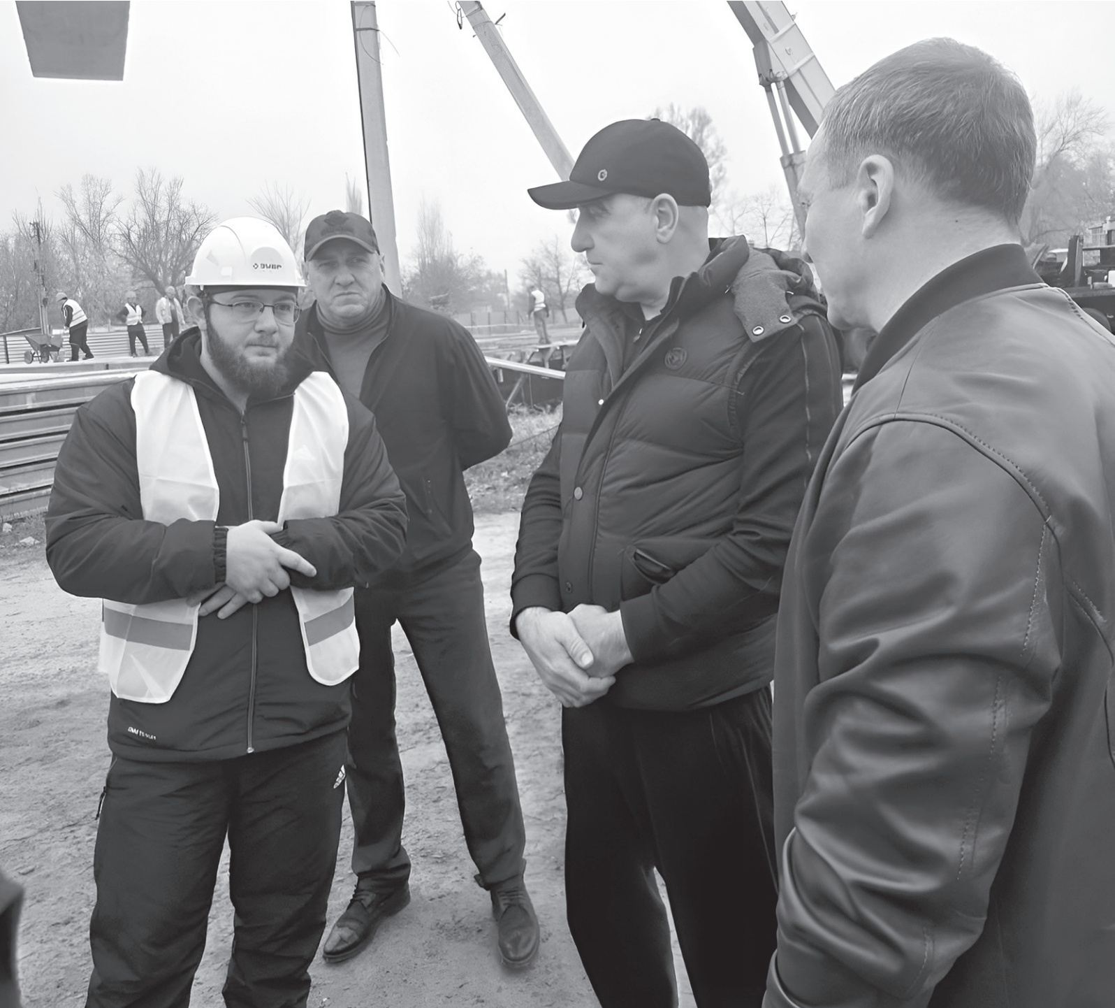
Рашид Темрезов с членами делегации республики посетили восстановленные объекты

Рашид Темрезов посетил Луганскую Народную Республику